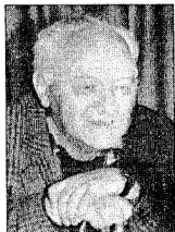
Gustaw Herling-Grudziński (1919–2000)

(4) Na następnym przesłuchaniu sprawa szpiegostwa ustąpiła miejsca ogólnikowej rozmowie na temat poglądów politycznych Kostylewa. Było jasne, że NKWD nie chciało odesłać go w takim stanie do Szkoły Morskiej i postanowiło przestawić śledztwo na inny tor. Nie mogło być już mowy o uratowaniu zmasakrowanej twarzy młodego inżyniera sowieckiego, ale można było jeszcze uratować twarz potężnej instytucji, która od dwudziestu lat stała czujnie na straży Rewolucji. Teoria prawa sowieckiego opiera się na założeniu, że nie ma ludzi niewinnych. Sędzia śledczy więc, gdy dostaje w ręce oskarżonego, może ostatecznie po długich badaniach zrezygnować z postawionego na wstępie zarzutu, ale to nie znaczy, żeby miał nie spróbować szczęścia gdzie indziej. Więźniowie śledczy znaleźli dla tego osobliwego proceduru świetne określenie: co ci przyczepili ? pytają powracających z przesłuchania towarzyszy. W rezultacie wyrok skazujący jest zawsze czymś w rodzaju kompromisu; oskarżony dowiaduje się, że nie przyszedł tu na darmo , a NKWD kultywuje bez przeszkód mit swojej własnej nieomyślności.