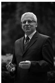
Jarosław Obremski Wiceprezydent Wrocławia

Serdecznie dziękujemy Państwu za dotychczasową pomoc, współpracę i wsparcie działań Wrocławskiego Szkolnego Związku Sportowego. Mamy nadzieję, że przedstawiona oferta okaże się pomocna w planowaniu Państwa pracy.