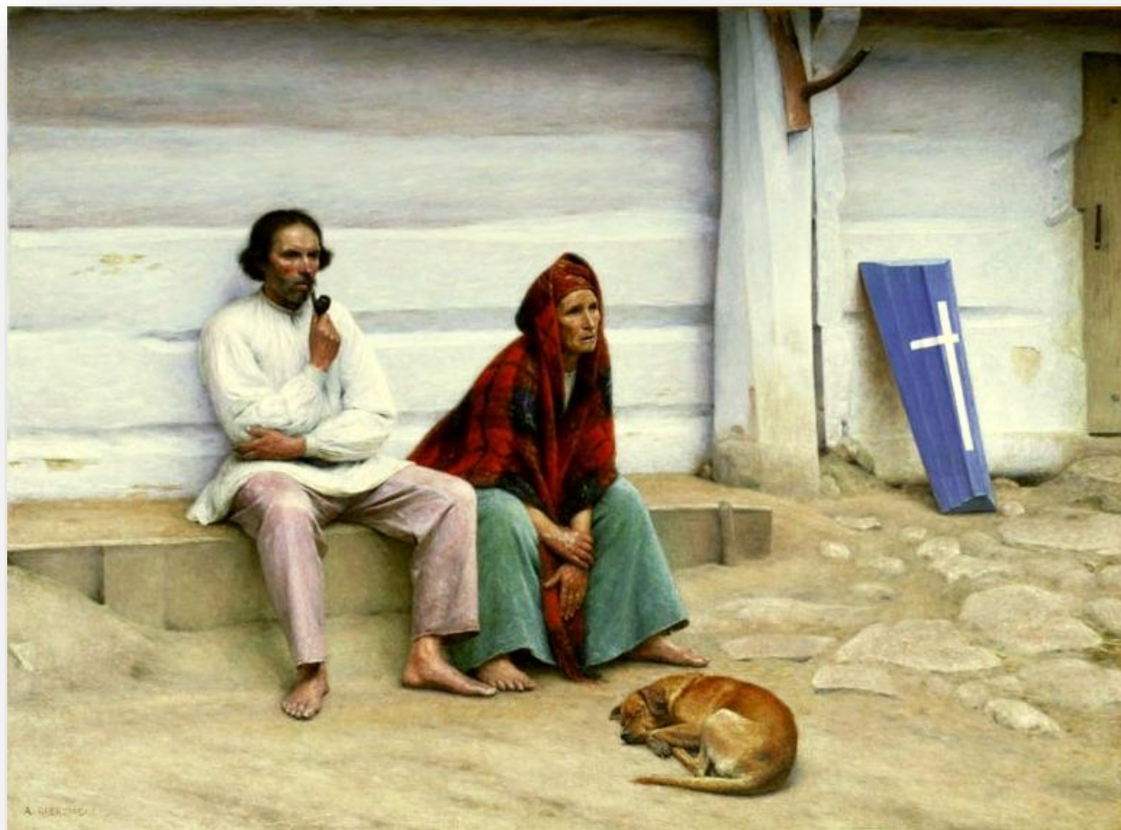
A. Gierzyński – Trumna chłopska