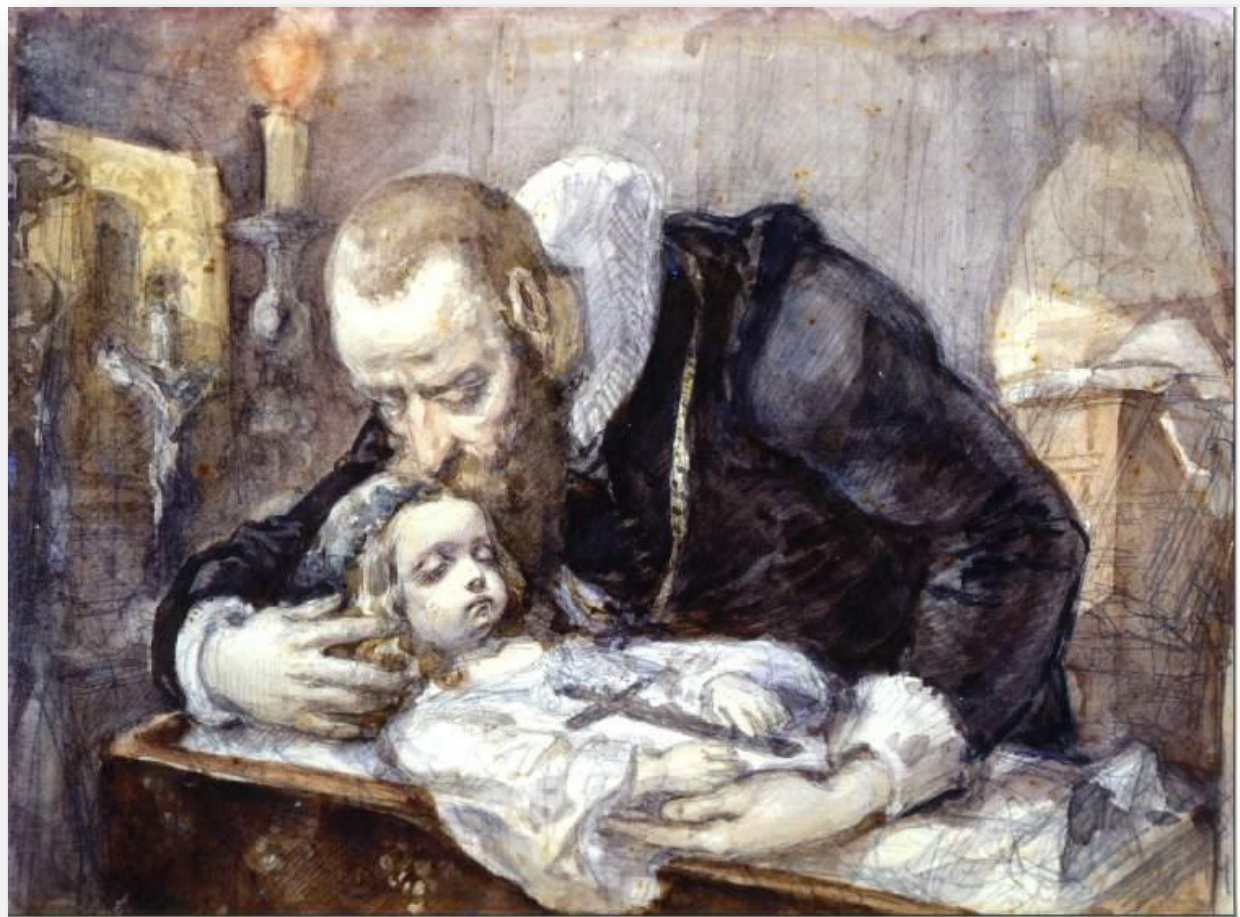
J. Matejko – Kochanowski nad zwłokami Urszulki