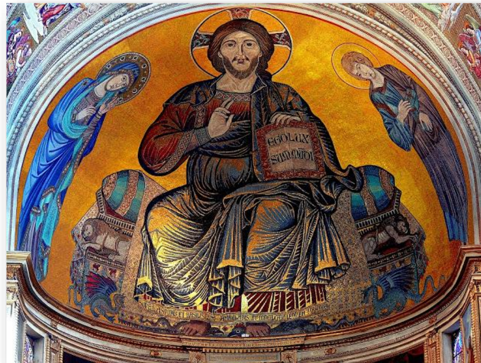
Deesis w Pizie