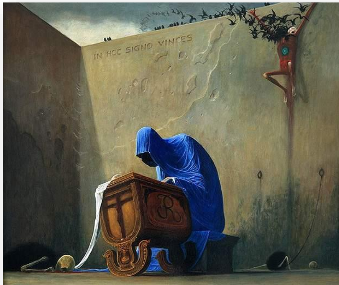
Z. Beksiński - Kotyska