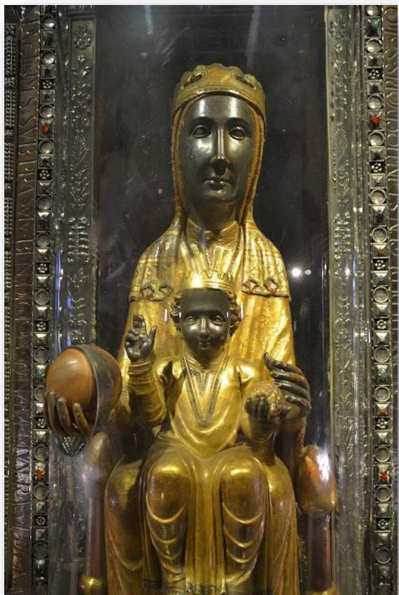
MB z Montserrat