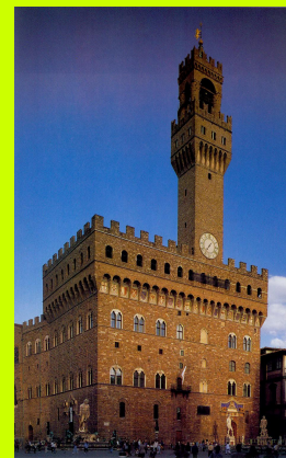
FLORENCJA – Palazzo Vecchio