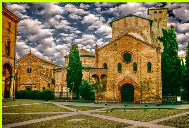
BOLONIA – kościół San Stefano czyli romańska Nowa Jerozolima