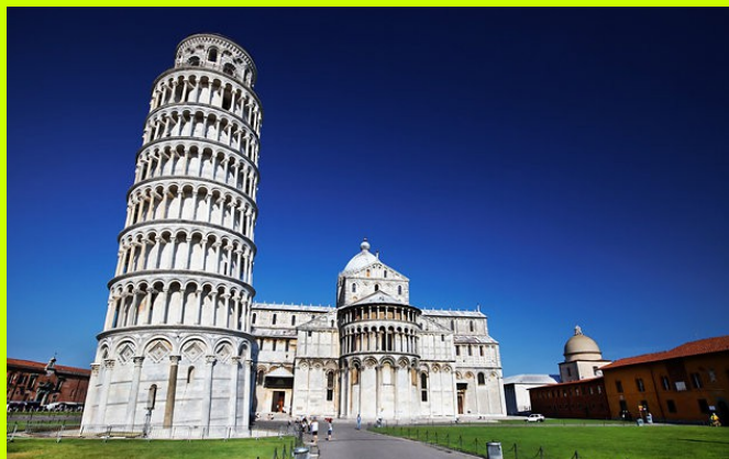
PIZA - kompleks katedralny z Krzywą Wieżą i baptysterium