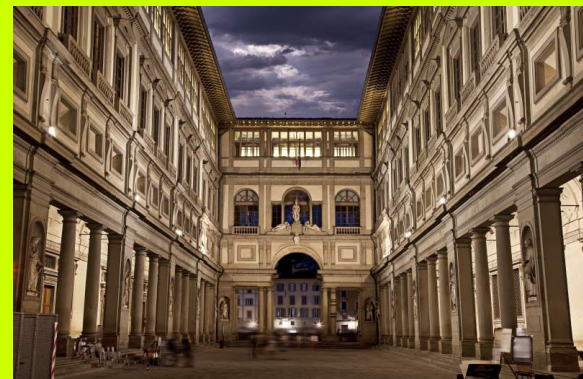
FLORENCJA - Uffizi czyli jedna z najważniejszych galerii sztuki w Europie