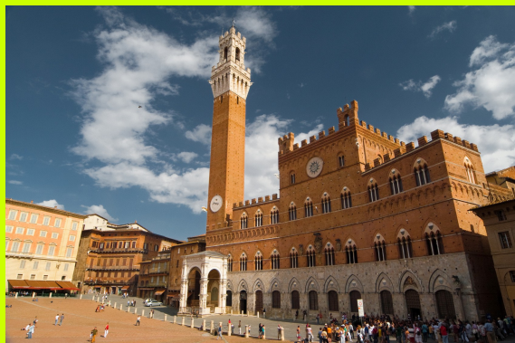
SIENA - Palazzo Pubblico i kompleks katedralny z biblioteką, baptysterium i muzeum katedralnym