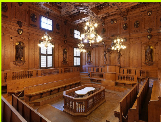
BOLONIA - najstarszy w Europie uniwersytet z Teatrem Anatomicznym