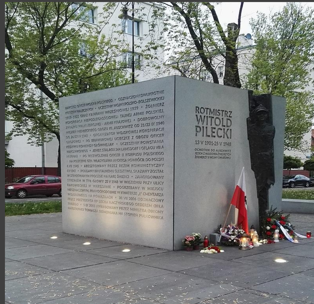
Pomnik w 119. rocznicę urodzin